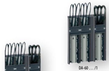
DA-60 ... /1

** Ochranné kryty poistkového spodku PTV-B 1,2 B 1,2 PRS sú HORNÉ / SPODNÉ