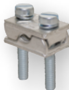
SP HVL ... P1