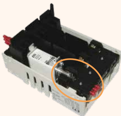
Monitor mechanickej poistky K-HVL00-3/H (v kombinácii s poistkami s kolíkovým úderníkom)