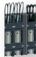
DA-60 ... /2