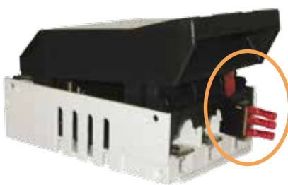
Indikátor polohy prepínača MST 00 1p+3p