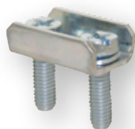
SP HVL ...