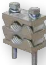
SP HVL ... P2