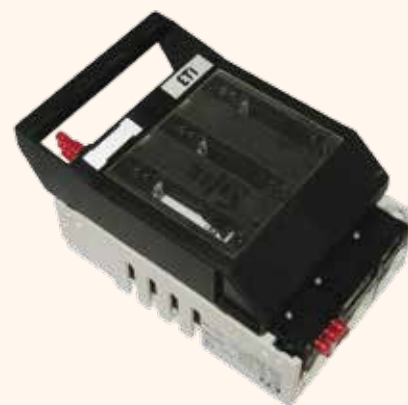
HVL-B00 3p + MST 00 1p+3p + K-HVL00-3/H