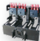
K-HVL00-3/H K-HVL1-3/H K-HVL2-3/H K-HVL3-3/H