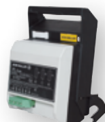
EFM HVL ...