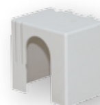
PRS ... MB 1p